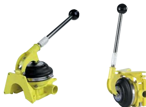
Gusher 10 Mk3 Standard BP3708

Accessoires de cale de grande qualité, comprenant les clapets anti-retour, les coudes et pièces en Y voir